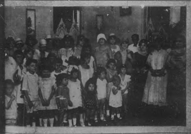
Lindos niños y distinguidas damas que presenciaron la celebración del Cuarto Escrutinio del Certamen que tuvo efecto en los salones del hotel "Louvre".