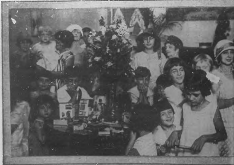
Los niños que asistieron al Cuarto Escrutinio de nuestro Certamen Infantil, esperando ansiosos e inquietos, los juguetes que momentos después les fueron repartidos.

las que obtuvieron mayor votación, era la que se encontraba presente, le fué entregado un precioso ramo de flores, obsequio delicadísimo de la importante casa de