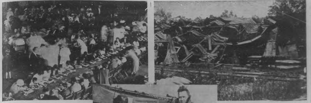
Los niños de las familias que quedaron sin hogar con motivo del horrible desastre del arsenal de Lake Denmark, fueron llevados al Morristown Armory, donde se le facilitó, como muestra la fotografía que aquí ofrecemos, hospedaje y alimentos.