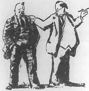
-Es muy útil ser calvo! En mis viajes no llevo jamás cepillo ni peine. -Entonces sáquese los dientes y ahorrará otro cepillo!

Cable y Telégrafo: BOHEMIA. Teléfonos: Dirección, M-1394; Administración, A-5658 y Talleres: M-5665. Apartado: 2169.