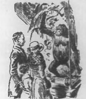
El nene.—¿Qué es eso, papá? El papá.—Una de nuestros antropólogos. El nene.—¿Qué cosa! ¿Quisiera mostrárselo a Perico, que dice que nosotros antropólogos vivimos con don Juan de Ganay?